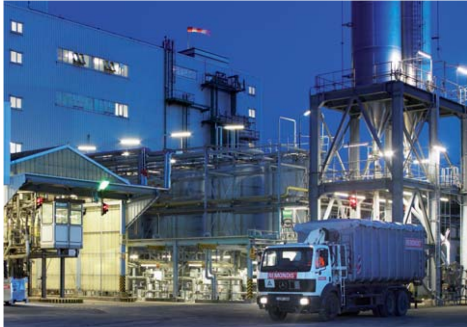
A modern technikák használata: innovatív üzemek biztosítják a gyártási folyamat legmagasabb mértékű biztonságát és a környezetvédelmi megfelelőséget. Kérésre akár az Önök telephelyén is.

Számos, a vállalati hulladékgazdálkodás terén megtevő referenciánk bizonyítja, hogy nemzeti és nemzet-