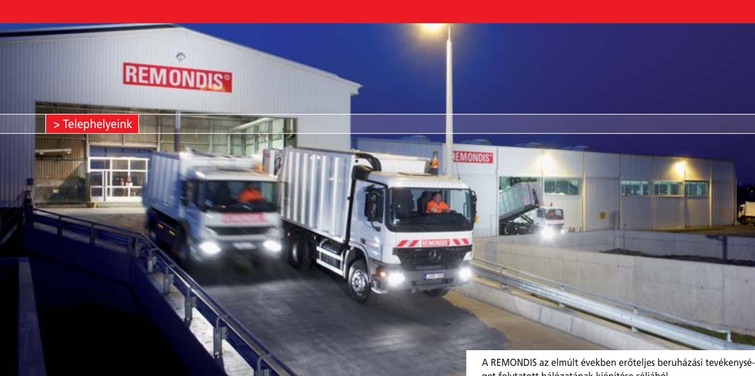
A REMONDIS az elmúlt években erőteljes beruházási tevékenységet folytatott hálózatának kiépítése céljából.